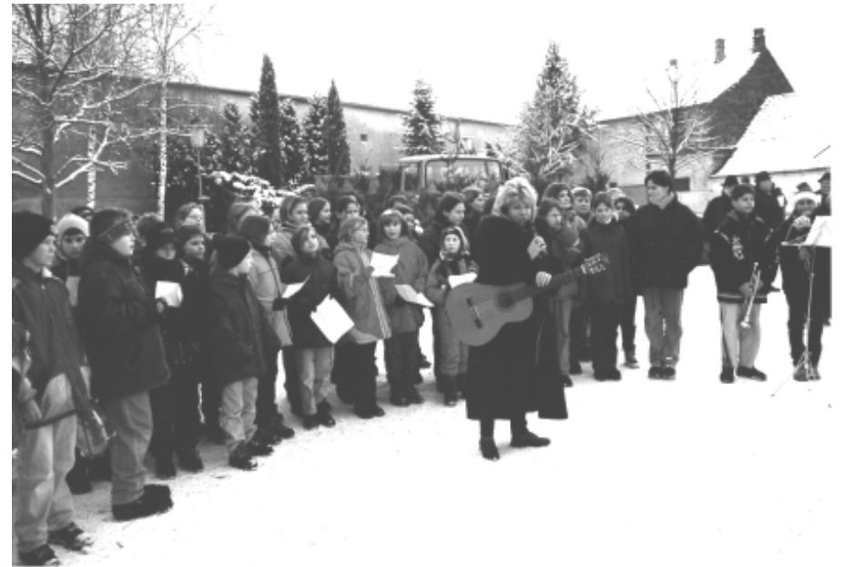
Der Chor der Hauptschüler