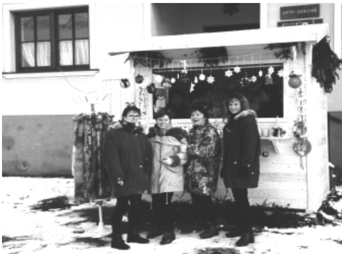
Man glaubt es nicht, es sollen Krampusse sein