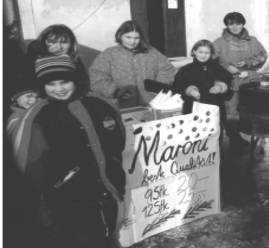
Maroni heiß und in bester Qualität