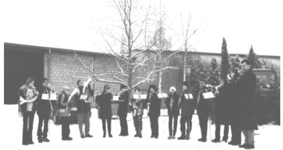
Weihnachtliche Stimmung durch die Ortsmusik