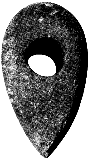
Beil (aus Grünstein) aus der jüngeren Steinzeit

Wenn Prähistoriker die jüngere Periode der Steinzeit für unsere Gegenden etwa in die Zeit um 2500 v. Chr. verlegen, dann ist das Gemeindegebiet von Bernhardsthal sicherlich seit ungefähr 4000 Jahren menschliches Siedlungsgebiet. Aus der jüngeren Steinzeit konnte nämlich Pfarrer Bock folgende Funde bergen: ein Beil, das beim Kellergraben im Hause Nr. 322 gefunden wurde; eine