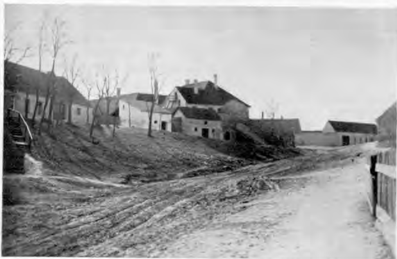
Der Burghügel (in der jetzigen Form).