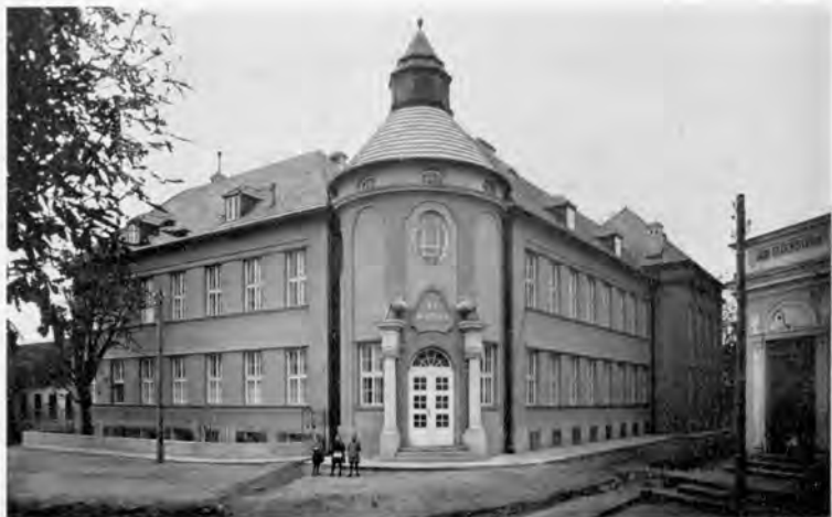
Lehr- und Erziehungsanstalt „St. Martha“

nordöstlichen Winkel von Niederösterreich, in der unmittelbaren Nähe der Staatsgrenze, erhöht noch ihre Bedeutung.