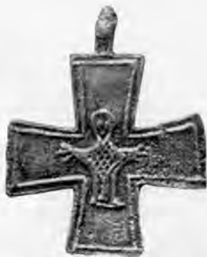
Bronzering mit Anhängern und Bleikreuz aus dem 9. Jahrhundert.

dentlich einfach und primitiv geformt, Füße nicht einmal angedeutet, als wären sie vom Kleide verdeckt. Das Kreuzchen ist 34 mm breit, 43 mm hoch und 1 mm dick.