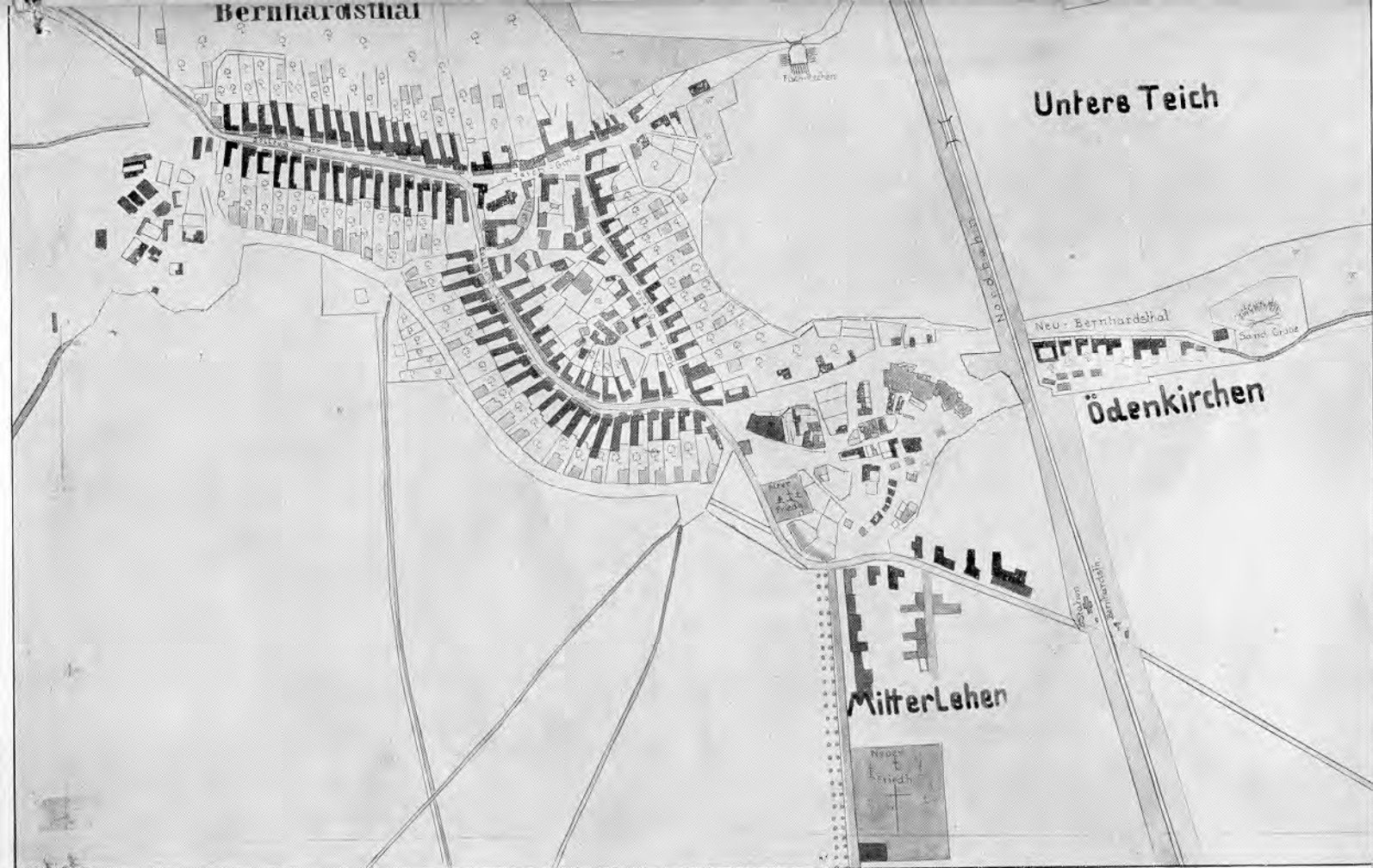
Ortsplan von Bernhardsthal