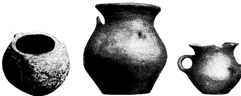
Gefäße aus der Bronzezeit

Was gefunden wurde, waren zunächst Schmuckgegenstände wie einfache Ketten, Ringe und Armbänder aus Bronze; dann Spinnwirteln, Steinhämmer, flache Steine, auf denen das Getreide ge-