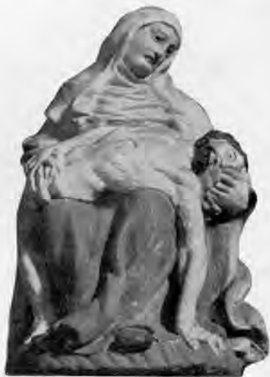
Statue der Schmerzhaften Muttergottes (am Marienaltar der Pfarrkirche)