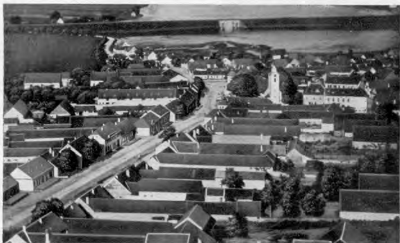
Fliegeraufnahme von Bernhardsthal

Als Filiale der Landwirtschaftlichen Genossenschaft für Dobermannsdorf erbaute sie 1924 ein eigenes Lagerhaus und nahm 1925 den Betrieb auf. Seit dem Jahre 1928 wird das Lagerhaus auf eigene Gebarung geführt. In diesem Jahre zählte die Genossenschaft 399 Mitglieder und hatte einen Jahresumsatz von 1,296.204 S. Acht Jahre später (1936) erreichte sie einen Stand von 711 Mitgliedern und einen Jahresumsatz von 2,042.337 S. Im Jahre 1937 dürfte die Zahl der Mitglieder noch etwas gestiegen, die Höhe des Jahresumsatzes aber trotzdem etwas zurückgegangen sein.