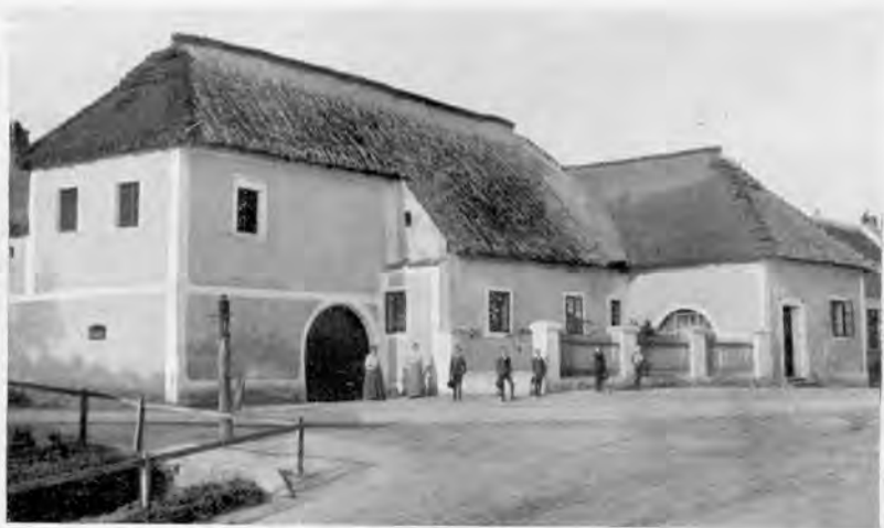
Haus Nr. 104 in der alten Bedachung