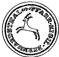
Pfarrsiegel vom Jahre 1800

Zwei Jahre später erscheint auf der Fassion der Pfarre zum erstenmal das amtliche Siegel, vielleicht das erste Pfarrsiegel von Bernhardsthal überhaupt. Es ist außerordentlich einfach und nüchtern und damit in einem gewissen Gegensatz zu den meist sehr komplizierten Siegeln der Adelligen, ihrer verschiedenen Ämter, ja auch der individuellen Siegel der einfachen Bauern und Gewerbetreibenden.