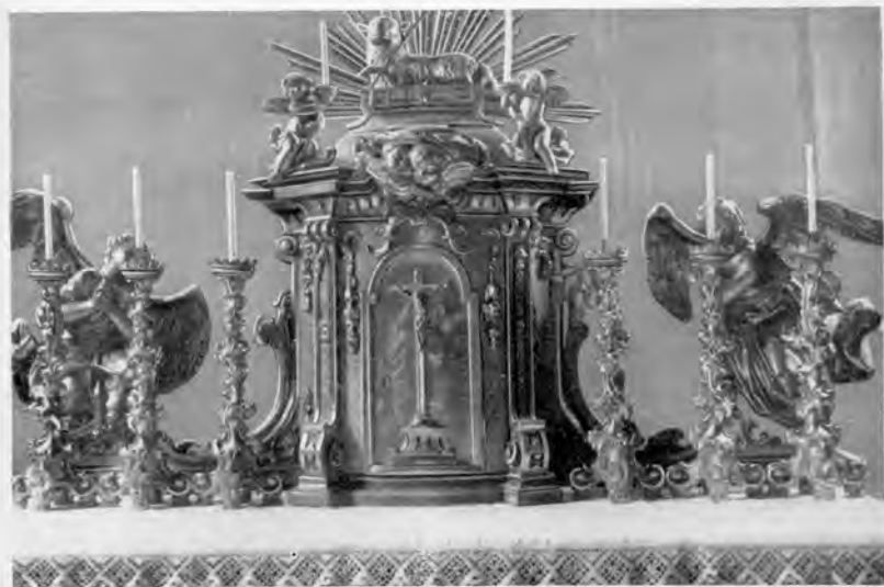
Hochaltar der Pfarrkirche

Der erstere und der letztere wurden überdies während der ganzen Arbeitszeit vom Pfarrer verköstigt. — Auch das Altarbild, darstellend den hl. Ägidius, wurde damals vom fürstlichen Hofmaler in Feldsberg neugemalt; leider mußte es im Jahre 1811 schon wieder renoviert und im Jahre 1856 vollständig entfernt werden.