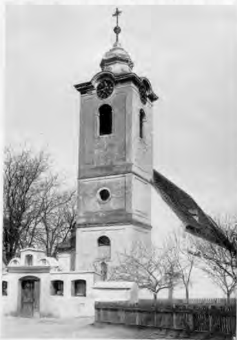
Turm der Pfarrkirche