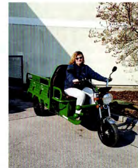
2 E-Lastendreiräder à € 2.390,- und