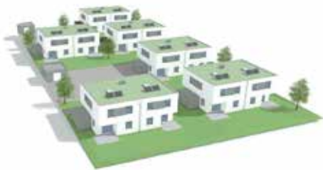
Arthur Krupp Ges.m.b.H.

So soll eine optisch ansprechende, mit vielen Grünelementen versehene, neue Siedlung unseren Einwohnern Freude bereiten.