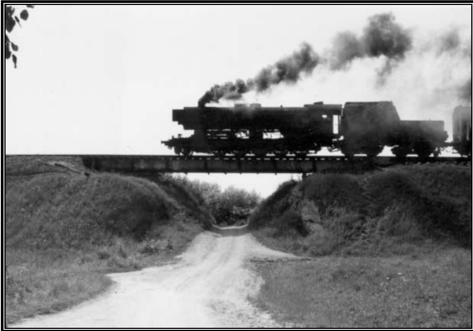
Lok 52 auf der 1945 gesprengten und nur provisorisch wiedererrichteten Brücke bei der Kapelle. Durch das Sprenggut war in der Brücke ein Hügel entstanden.