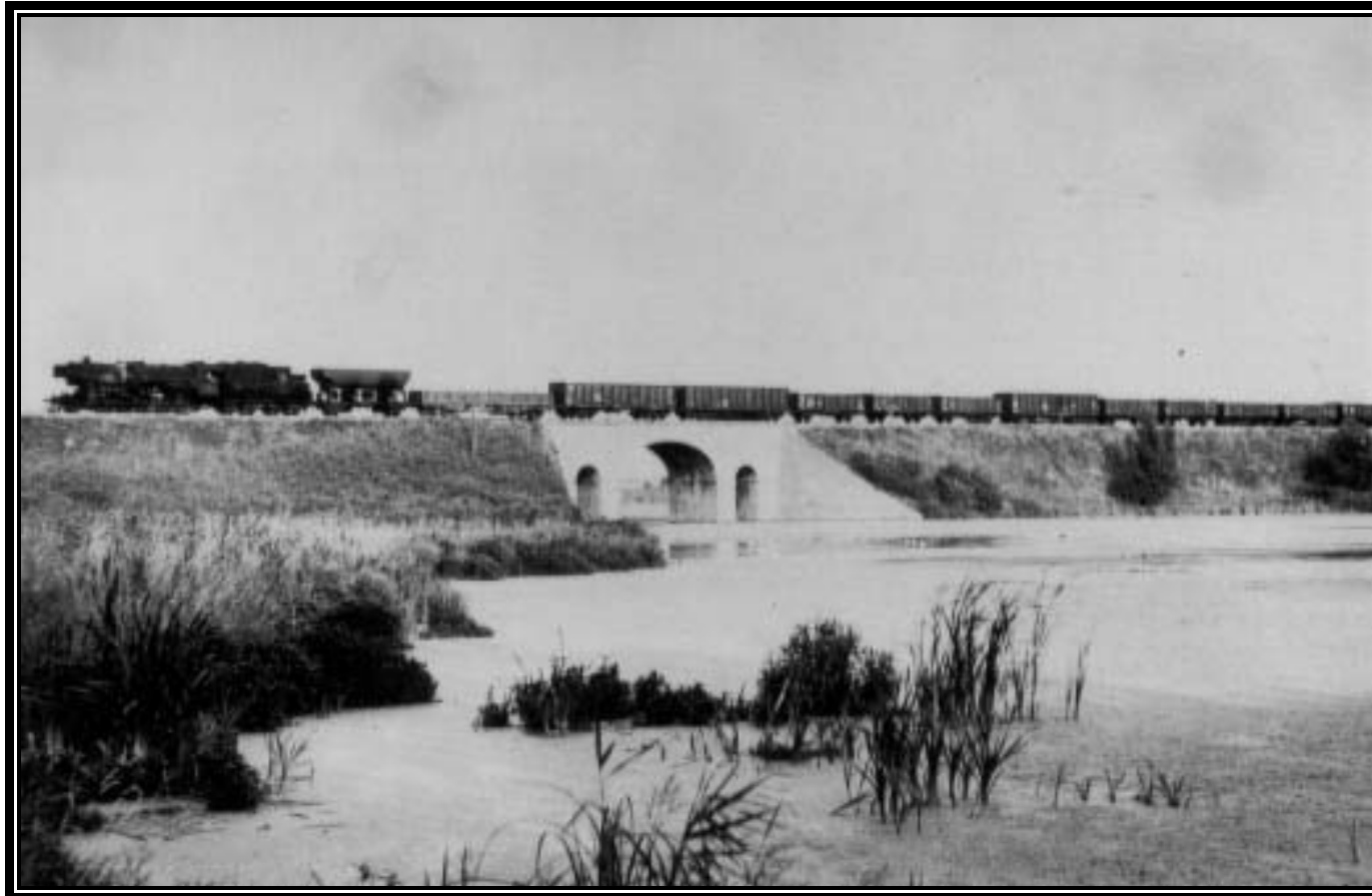
Lok 52 mit Lastzug auf der mittleren Brücke, 1970