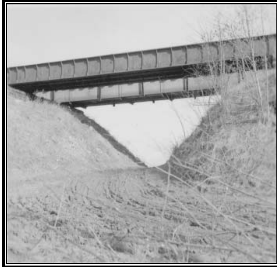
Kapellenbrücke um 1950. 2 Eisenkonstruktionen bilden Ersatzbrücken für die gesprengte Brücke, das Sprenggut bildet einen Hügel unter der Brücke