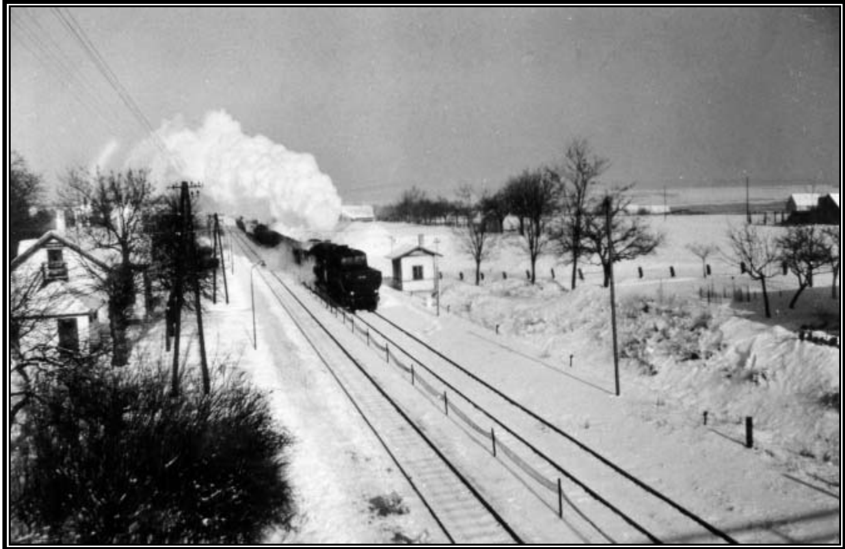
Winteraufnahme einer 52er, etwa 1950-55. Die Linden sind groß, das Huber-Gärtner-Haus steht (ganz rechts), der Teich ist bespannt. Aufnahme von der prov. Holzbrücke -siehe Schatten.