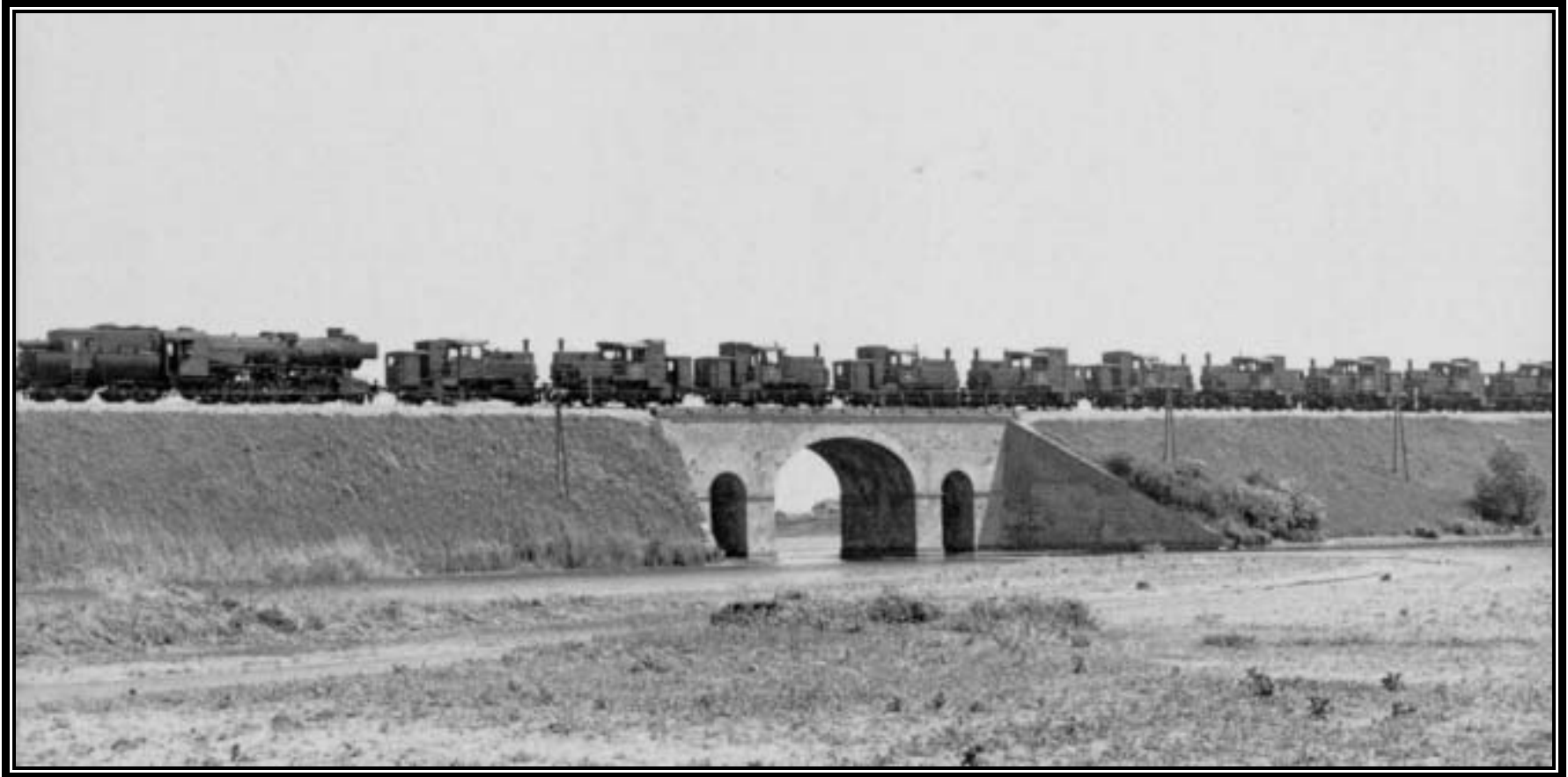
Transport alter Lokomotiven mit 52er, 1968