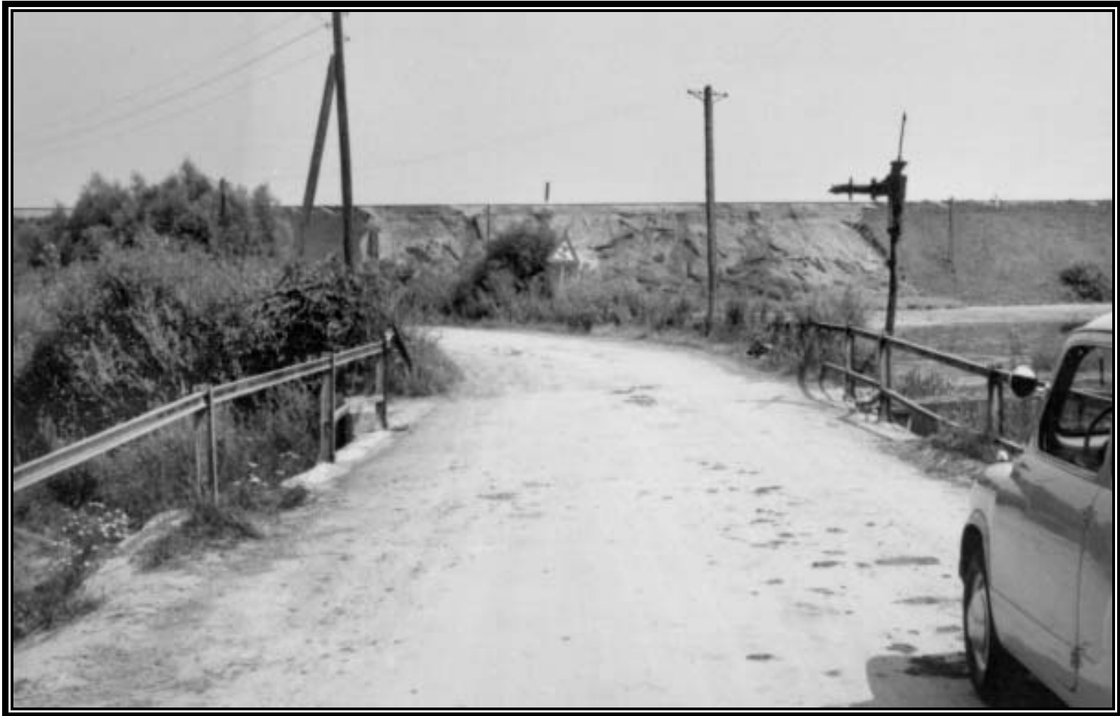
Lundenburgerstraße, dahinter der abgerutschte Bahndamm 1958, rechts an der Brücke die Wasserentnahme aus dem Hamelbach