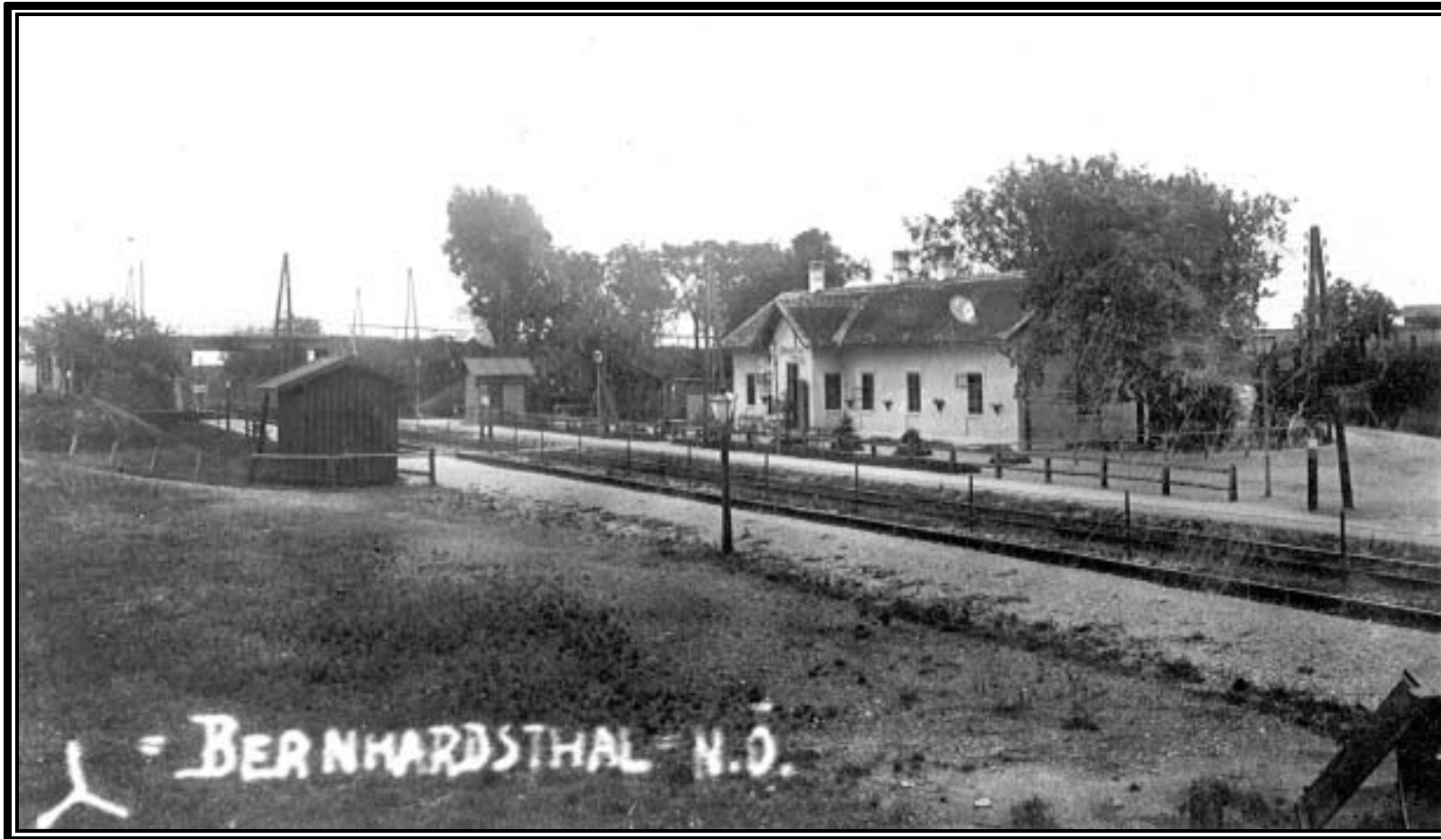
Die Bahnhaltestelle 1932 mit Brücke und Signalhäusl. Je nach Anfahrtsrichtung eines Zuges wurde zwei- oder dreimal geläutet. Vor dem Haus ein Abstandsgatter und Koniferen. Links, im rückwärtigen Teil des heutigen Wartesaals, war zu dieser Zeit der erste Konsum, der später ins Weilinger-Wirtshaus am „Konsumberg“ übersiedelte.