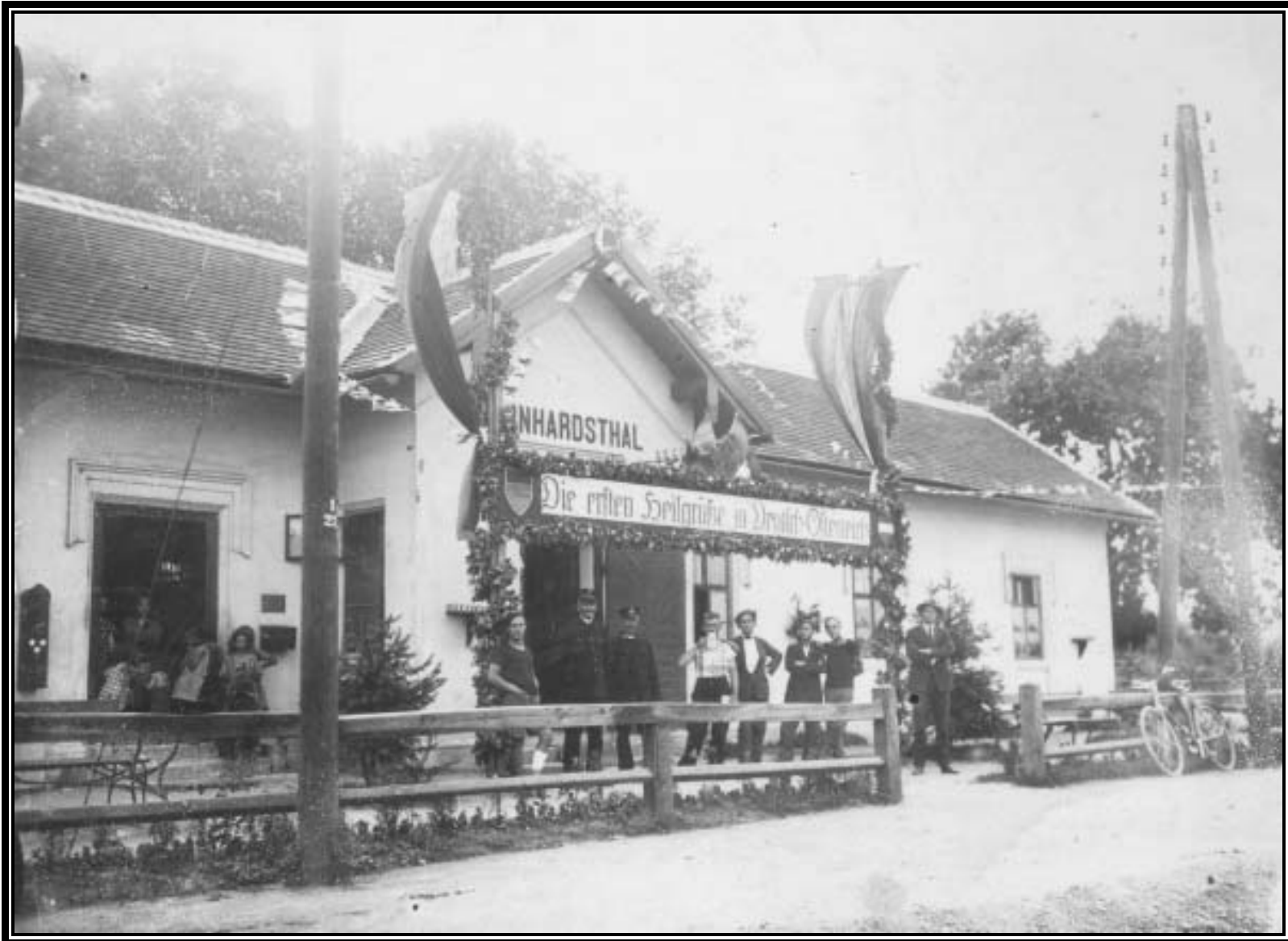
Haltestelle im Schmuck zum Sängerbundesfest 1928.