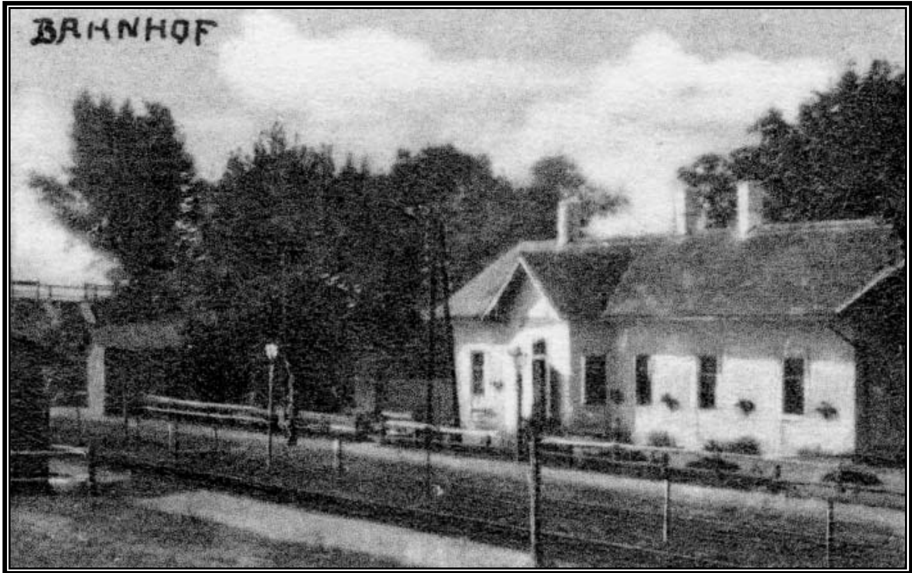
Bahnhaltestelle um 1930