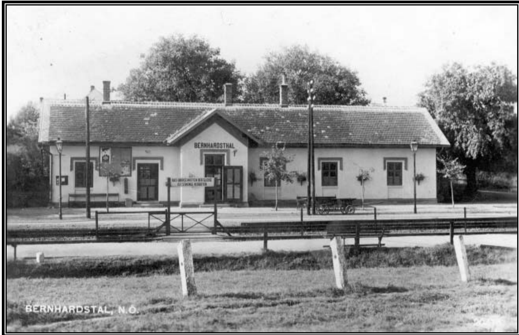
Die schon gepflanzten Linden deuten auf 1936 - 1938, der unsymmetrische Anbau, drittes Fenster Nord ist deutlich am Dach erkennbar. Er wurde um 1970 wieder entfernt.