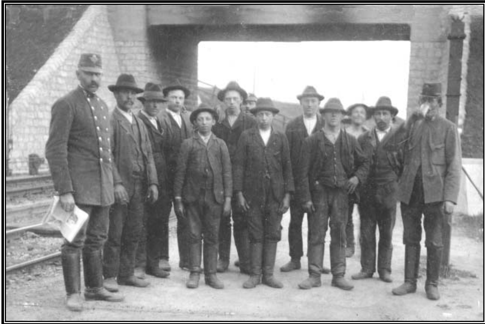
Oberbauarbeiter ? vor der 1905 errichteten Beton-Bahnbrücke. Sie wurde 1945 gesprengt und nachher durch eine Holzbrücke ersetzt.