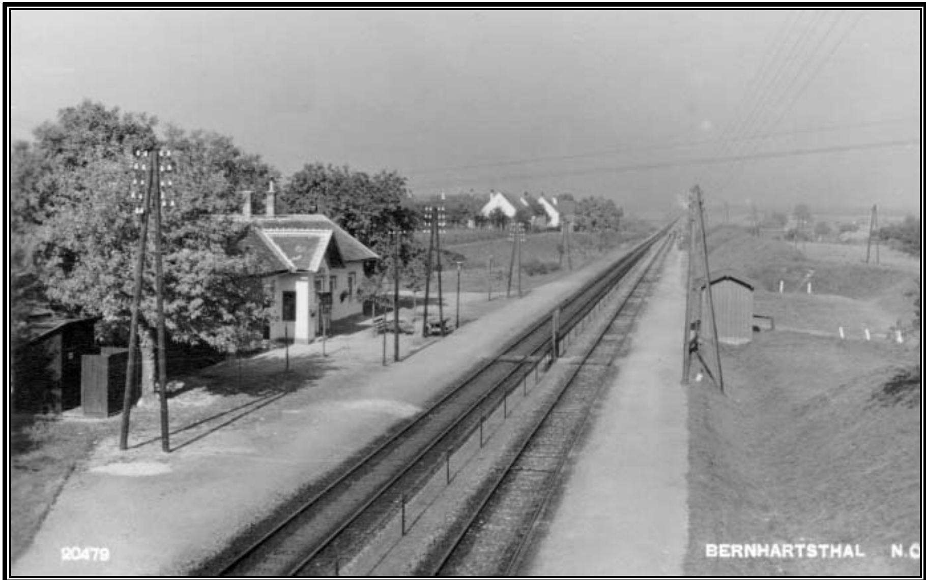
Die Bahnhaltestelle etwa 1938. Das Gatter fehlt, vor dem Haus sind 4 Linden gepflanzt