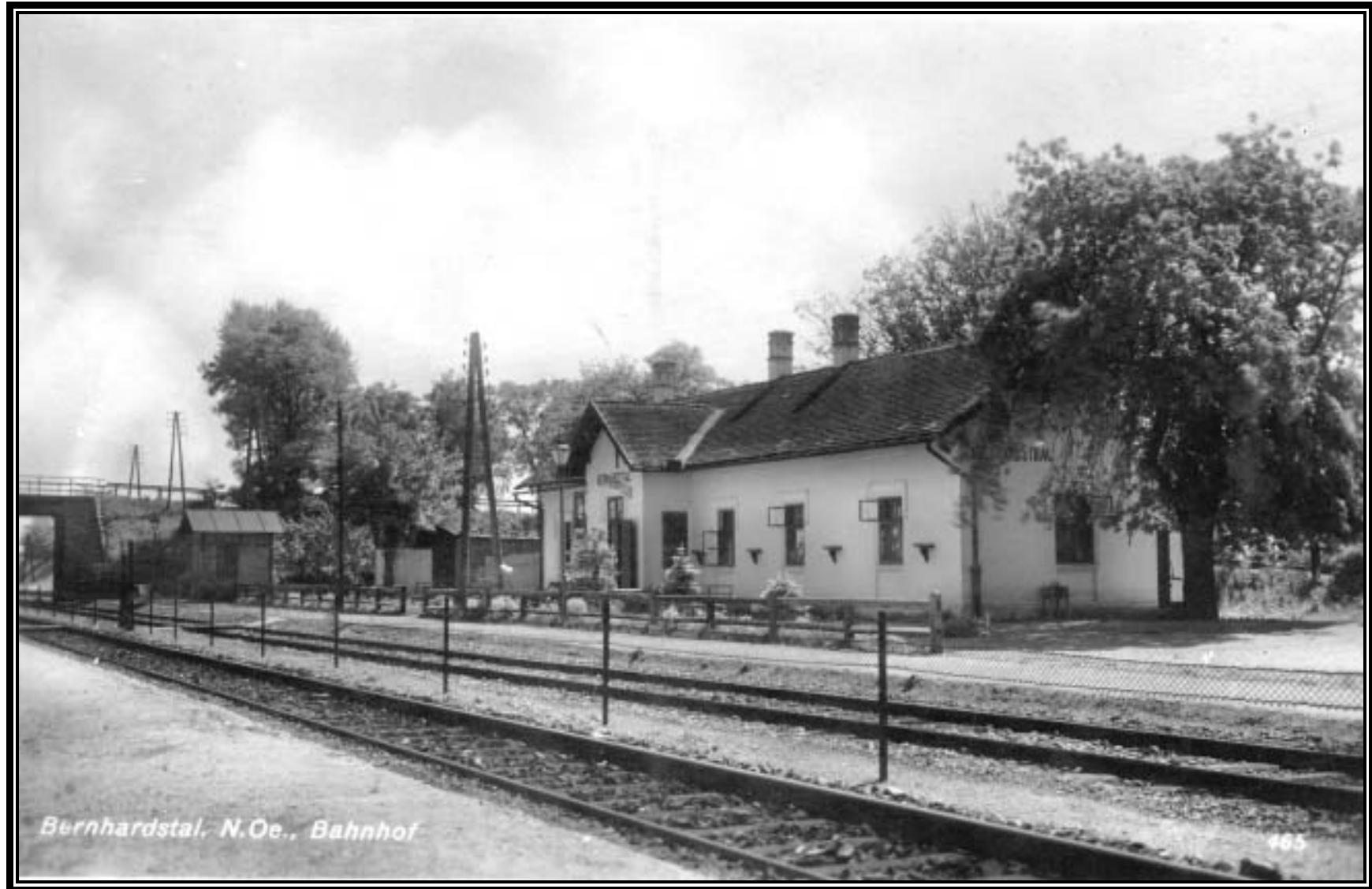
Die am 15. Mai 1872 eröffnete Bahnhaltestelle 1932. Rechts hinter dem Baum ist der Brunnen gut sichtbar.