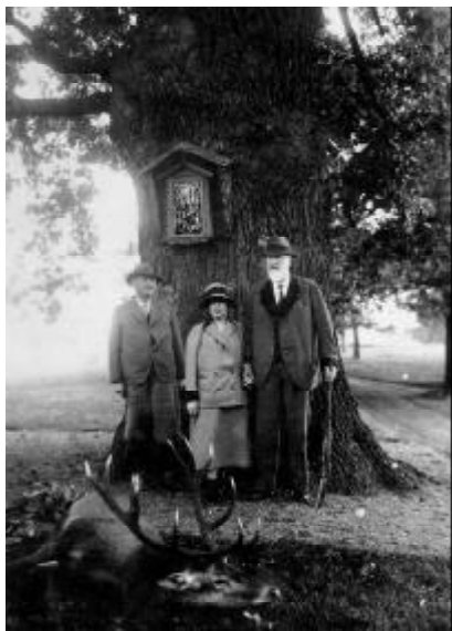
Fürst und Fürstin mit Kapitalhirsch vor dem Lahnenschlößl

Um 1830 heißt es im Gedenkbuch der Pfarre: „Es befinden sich in den Auwäldern Rehe und Hirsche. Von diesen letzteren werden jährlich einige gefangen, in den Feldsberger Theim verpflanzt und zu Parforce-Jagden (Hetzjagden) verwendet. Die andere Jagd ist gleichfalls beträcht-