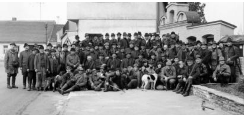
Hauptjagdteilnehmer am 4.11.1971. Es wurden 640 Hasen, 9 Fasane und 68 Rebhühner erlegt.