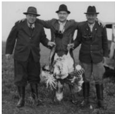
Drei glückliche Jäger mit der letzten in Bernhardsthal erlegten Trappe (1952)