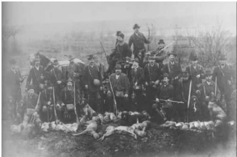
Treibjagd um 1911