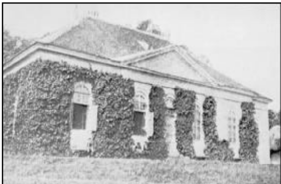
Lahnenschlößl, Bernhardsthal Nr.254

lich. Die Menge von Remisen, in welchen sich die Hasen, Rebhühner und Fasane ver-