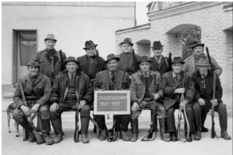
Jagdgesellschaft 1965 - 1971