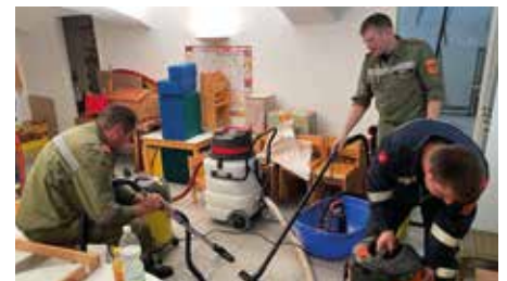
Besonderer Dank gilt der FF Bernhardsthal

Kurz vor Beginn des aktuellen Kindergartenjahres wurde die Gemeinde durch den unvorhersehbaren Wasserleitungsschaden im Keller des Kindergartens überrascht. Alle nötigen Maßnahmen wurden sofort getroffen und entsprechende Fachfirmen mit der Trocknung und Sanierung beauftragt. Es ist uns ein wichtiges Anliegen, den Betrieb im Kindergartenturnsaal so rasch wie möglich wieder aufzunehmen.